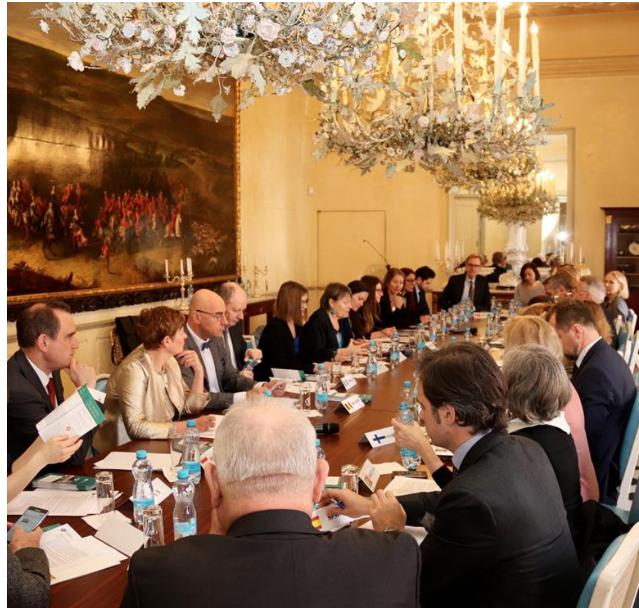
Francouzská ambasáda v Praze (duben 2018)

Informace velvyslancům, že na VOP mohou odkazovat své občany, kteří se na ně obrátí