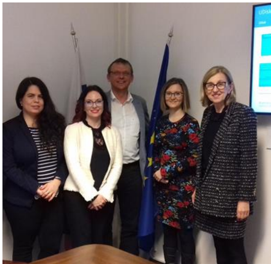
Schůzka European Network of Ombudsmen

Zástupci z kanceláří národních ombudsmanů zemí střední a východní Evropy a kanceláře Evropské ombudsmanky