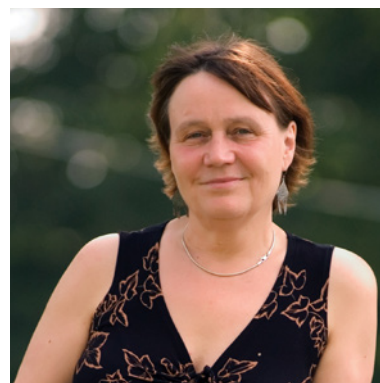
Mgr. Anna Šabatová, Ph.D. veřejná ochránkyně práv

Na základě pilotního školení pro policisty z Krajského ředitelství policie Jihomoravského kraje, jež se uskutečnilo ještě v roce 2014, proběhla v roce 2015 školení pro dalších 8 krajských ředitelství. V roce 2016 se pak uskutečnila školení pro zbývajících 5 krajských ředitelství. Pro každé krajské ředitelství tak proběhlo jedno školení s tím, že pro středočeské a pražské krajské ředitelství se uskutečnila vzhledem k jejich velikosti dvě školení. Celkem se tedy realizovalo 16 školení , jichž se zúčastnilo přibližně 900 policistů .