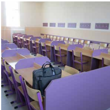
příklad liniového uspořádání návštěvních místností

V některých věznicích byly stoly v návštěvních místnostech uspořádány liniově, v důsledku čehož bylo minimalizováno soukromí při návštěvách, odsouzení a jejich návštěvy se vzájemně rušili.