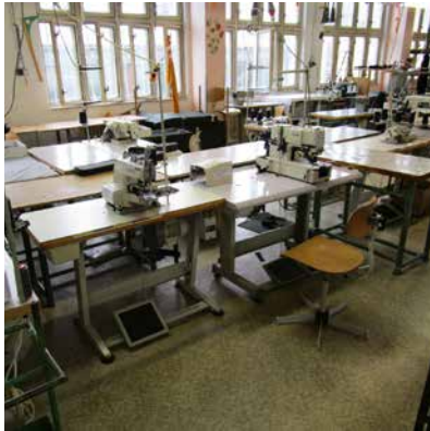
pracoviště odsouzených – šicí dílna

o výši a podmínkách odměňování odsouzených osob zařazených do zaměstnání ve výkonu trestu odnětí svobody).