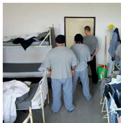
příklad hromadného ubytování