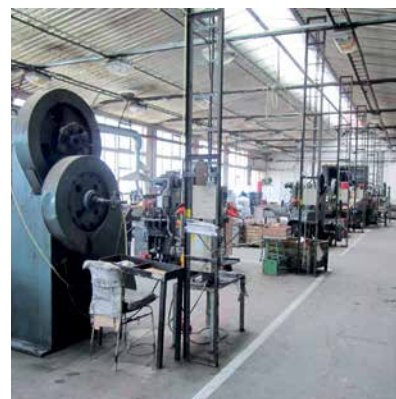
příklad pracoviště odsouzených v areálu věznice

Za zaměstnané lze považovat ty odsouzené, kteří jsou reálně zaměstnaní, nebo i ty, kteří se účastní vzdělávacích, terapeutických programů či vykonávají práce pro zajištění chodu věznice bez nároku na pracovní odměnu. Podíl zaměstnaných odsouzených lze pak vztahovat buďto ke kmenovému stavu věznice (tedy všichni odsouzení) anebo pouze k těm, kteří jsou zaměstnatelní (práce schopní). Lze takto vyřadit z výpočtu některé skupiny vězňů a to z nejrůznějších důvodů – ti, kteří odmítli pracovat (kterých je však minimum – 20 vězňů 45 ve všech věznicích); ti, kteří jsou v nástupním oddělení, ti, jejichž zdravotní stav jim neumožňuje trvale pracovat; ti, u kterých existují právní či bezpečnostní důvody pro nezařazení do práce; ti, kteří jsou v ochranné léčbě; ti, kteří jsou starší 65 let; ti, kteří jsou plně invalidní; další, o kterých tak stanoví řád výkonu trestu, respektive jsou podle něj vyňati z povinnosti pracovat. Poměrně zásadní je tedy věnovat pozornost metodice výpočtu zaměstnanosti.