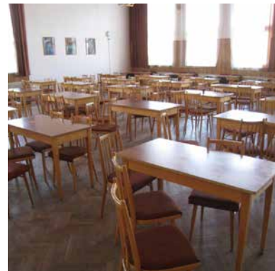
příklad „restauračního“ uspořádání návštěvní místnosti

Osobně považuji za vhodnější tzv. restaurační uspořádání návštěvních místností (tzn. samostatné stoly). Kontrolu a prevenci předávání návykových látek je vhodno provádět prostřednictvím kamerových systémů, nikoliv omezováním soukromí při návštěvách či omezováním kontaktů odsouzených s návštěvami.