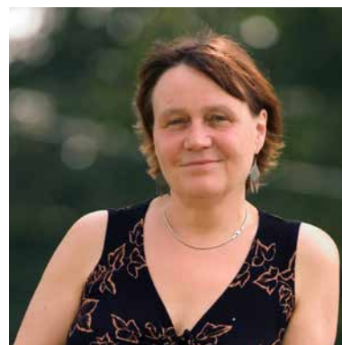
Mgr. Anna Šabatová, Ph.D. veřejná ochránkyně práv

Již od roku 2001 veřejný ochránce práv navštěvuje věznice a řeší podněty týkající se podmínek výkonu vazby či trestu odnětí svobody a postupu Vězeňské služby ČR. Posledních deset let rovněž vykonává preventivní systematické návštěvy ve smyslu Opčního protokolu k Úmluvě proti mučení. Za tu dobu vydal několik významnějších zpráv z oblasti vězeňství. Jde zejména o zprávu z návštěv věznic z roku 2006, v níž shrnul poznatky z návštěv věznic s ostrahou a zvýšenou ostrahou a zprávu z návštěv vazebních věznic z dubna 2010. Významnou publikací je také sborník stanovisek Vězeňství publikovaný v roce 2010. Již tehdy JUDr. Otakar Motejl v předmluvě doporučil, aby o přeřazování odsouzených do jednotlivých typů věznic namísto soudů rozhodovala přímo Vězeňská služba ČR. Neočekával, že by se jeho myšlenka mohla naplnit dříve než za několik let, považoval však za nutné ji znovu, a možná naléhavěji zopakovat. K návrhu prvního ombudsmana se připojuji.