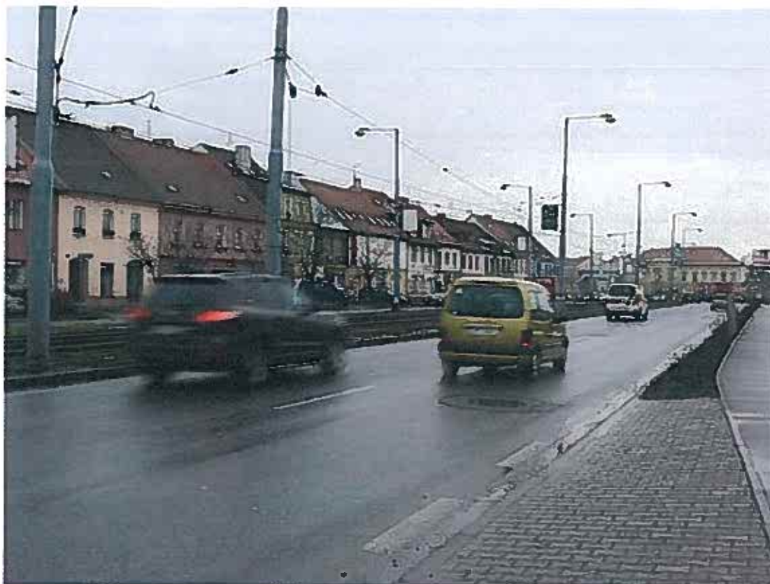
Ilustrační foto Autor: DENÍK/Lukáš Matoušek

Vyškovsko - Řidiči projíždějící Vyškovskem kritizují nedostatečné vodorovné značení na silnicích. Cestáři slibují, že některé chyby napraví už v příštím roce.