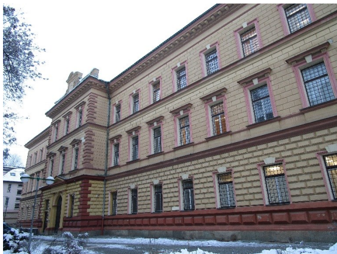
Obrázek 1: Pohled na věznici z ulice U Soudu

Vazební věznice Liberec (dále jen „věznice“) stojí v běžné městské zástavbě v historické budově z roku 1877, která v letech 2001–2004 prošla rekonstrukcí. 8 Ve věznici se nachází přijímací oddělení, oddělení s ostrahou se středním stupněm zabezpečení, oddělení s ostrahou s vysokým stupněm zabezpečení, krizový oddíl, uzavřený oddíl a oddělení pro výkon vazby, 9 na něž byla systematická návštěva zaměřena.