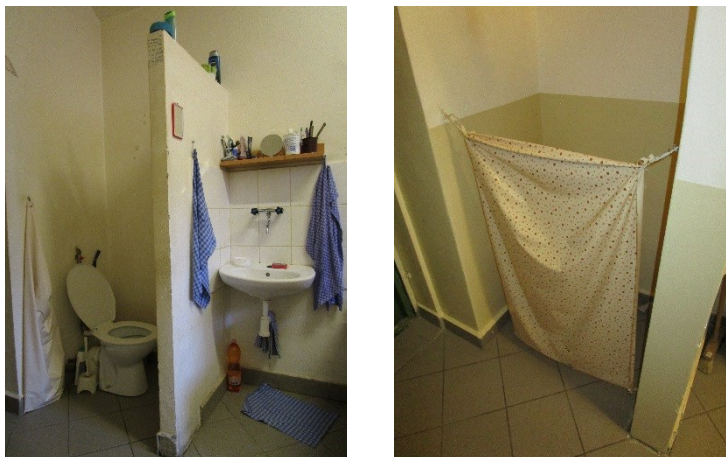
Obrázek 7 a 8: Toalety na běžných celách

V navštívené věznici bylo sanitární zařízení odděleno od ostatního prostoru právě pomocí plastového závěsu a stavební příčky, jak vyplývá z fotografií. Toto řešení považuji za nedostatečné a nesplňující výše uvedené standardy. Současně si na nedostatek soukromí stěžovali i samotní obvinění, kteří tráví na celách většinu svého času s ostatními obviněnými. Toalety na celách měly být od zbytku místnosti odděleny takovou přepážkou, která zaručuje zachování důstojnosti obviněných.