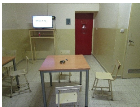
Obrázek 5 a 6: Oddělení výkonu vazby se zmírněným režimem

První z nich je z mého pohledu nedostatečné zajištění soukromí obviněným, kteří mají lůžka v průchozí cele. Většinu dne nemají klid kvůli obviněným procházejícím touto místností. Tímto se pro ně z možnosti využívat výhod zmírněného režimu stává obtěžující povinnost, kterou musí strpět.