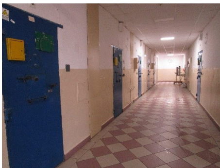
Obrázek 4: Křídlo patra, v němž byli umístěni jak obvinění muži, tak i obviněné ženy

Vzhledem k tomu, že jsou ženy umístěny na stejném patře s muži, většina sloužících příslušníků byli muži. Ti však v rámci výkonu svých pracovních úkolů musí nahlížet do cel obviněných, přičemž současně nemohou vědět, zda se osoby na cele nepřevlékají či nejsou na toaletě. Problematické situace nastávají ve věznici při výměně vězeňského oděvu a prádla, k čemuž se budu vyjadřovat v následující kapitole.