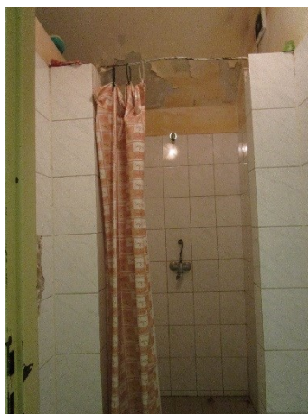
Obrázek 9: Sprchový kout na oddíle se zmírněnou vazbou

Situace je opět odlišná na oddíle se zmírněnou vazbou, kde jsou pro obviněné k dispozici dvě toalety (samostatné malé místnosti). Do jedné je přístup přes kulturní místnost, druhá se nachází v místnosti na druhém konci oddílu. Na oddílu je též umístěna sprcha, která je však velice neestetická mimo jiné z důvodu opadávající omítky. Považuji za vhodné, aby byly zmíněné nedostatky sanitárního zařízení na oddíle se zmírněnou vazbou odstraněny.