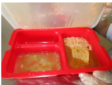
Obrázek 10 a 11: Umístění stolu na některých celách a plastový tablet s obědem

V některých celách umístění stolu neumožňuje, aby u něj seděli všichni obvinění umístění na cele. Nemožnost stravovat se u stolu považují za nedůstojné, stejně jako konzumaci jídla z plastových tabletů (viz foto výše). Některé vazební věznice již v dnešní době vydávají obviněným stravu v talířích, tuto praxi doporučuji i navštívené věznici. Navíc se domnívám, že by těm obviněným, u kterých to nepředstavuje bezpečnostní riziko, mělo být umožněno jíst kompletním příborem.