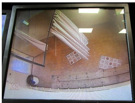
Obrázek 3: Výstup z kamery v místnosti pro provádění důkladných osobních prohlídek

Na druhou stranu jsou však pochopitelné stížnosti obviněných majících nepříjemný pocit z toho, že místnost, v níž se svlékají donaha, je sledována kamerou. Domnívám se, že kromě toho, že by měla kamera pouze vytvářet záznam, k němuž bude mít přístup omezené množství zaměstnanců, a to jen pro účely šetření věznice či jiného kontrolního orgánu, měli by o těchto skutečnostech být obvinění poučeni. Takové poučení lze umístit ve stručné podobě na tabulce při vstupu do prohlídkové místnosti, dále je lze uvést ve vnitřním řádu věznice, ale zejména považuji za vhodné, aby vězněné osoby byly o způsobu používání kamery před započítím prohlídky ústně poučeny příslušníkem Vězeňské služby České republiky (dále jen „příslušník“).