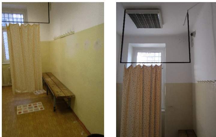
Obrázek 1 a 2: Místnost pro provádění důkladných osobních prohlídek

incidenty, které se odehrály v místnosti určené pro provádění důkladných osobních prohlídek.