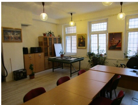
Obrázek 12: Kulturní místnost v 1. patře využívaná v době návštěvy pouze mladistvým obviněným

Nastavený režim aktivit považuji za nedostatečný a netransparentní. Nejenže obvinění neví, jakých aktivit se mohou účastnit, není ani vedena evidence, kteří obvinění byli na aktivitu kdy navedeni. Za současného systému je možné, aby obviněným z některých cel bylo specializovaným pracovníkem opakovaně umožňováno trávit čas na aktivitách, přičemž žádosti ostatních budou ignorovány. Z tvrzení obviněných vyplývá, že se na aktivitu mimo celu dostávají přibližně jednou týdně, někteří ovšem uváděli, že na žádné aktivitě nebyli již delší dobu než týden. To znamená, že obvinění, kteří na cele nemohli sledovat televizi, si mohli celý den pouze číst či poslouchat rádio (a to pouze jednu přednastavenou stanici). Toto shledávám nepřijatelným.