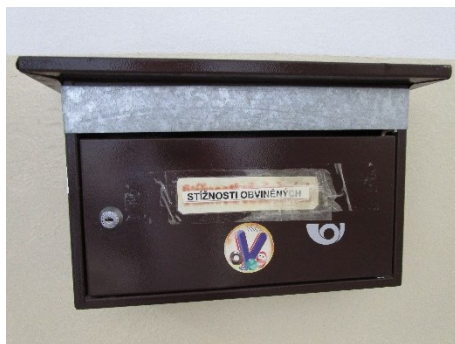
Obrázek 16: Schránka na stížnosti

Možnost podávání stížností je jedním ze základních nástrojů, který mohou obvinění použít, aby poukázali a případně následně i vyřešili problémy, kterým mohou ve vazbě čelit. Funkční stížnostní mechanismus je tedy důležitý pro prevenci špatného zacházení. Aby osoby neměly obavy z toho, kdo může jimi podané stížnosti číst, měly by být ke stížnostem vyhrazené zvláštní schránky nesoucí označení, kdo je odpovědný za jejich vybírání.