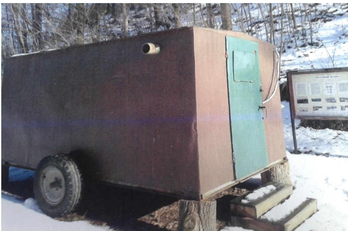
Obrázek č. 2 – pohled na maringotku sloužící jako promítací kabina (foto pořízené stěžovatelem dne 8. 2. 2019)

vždy výsledkem správního uvážení tzv. volného hodnocení důkazů příslušného stavebního úřadu 12 . Mantinely volného hodnocení důkazů jsou dány ustanovením § 50 odst. 4 správního řádu. V rámci správní úvahy stavební úřad nemůže pominout ani soudní judikaturu k dané otázce. 13 Z ní bych zmínil jeden z prvních právních závěrů k otázce výrobku plnicího funkce stavby, kdy Městský soud v Praze konstatoval (dále cituji): „Stavební zákon hovoří zcela obecně o výrobcích, ale nevylučuje tedy z této definice předem žádné typy výrobků, tj. ani silniční vozidla, ať už motorová, nebo nemotorová. Bude-li silniční vozidlo umístěno na pozemku trvale a bude trvale plnit určitou funkci vyhrazenou zpravidla jen stavbám, bude umístění takového výrobku na pozemku podléhat ohlášení stavebnímu úřadu.“ 14