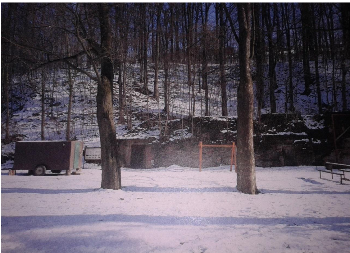
Obrázek č. 3 – pohled na přemístěnou maringotku (foto pořízené stěžovatelem dne 8. 2. 2019)

Argument stavebního úřadu, že stavebník „popojel“ s maringotkou na pozemkovou parcelu, která sousedí s pozemky, na kterých se nachází letní kino, a tudíž nejde o výrobek plnící funkci stavby, nemohu se zřetelem k výše uvedenému přijmout. Daný názor považuji za značně problematický, neboť by vedl k neodůvodněným aplikačním rozdílům.