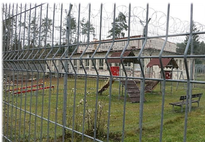
Obrázek č. 8: výhled z okna ubytovny na plot s ostnatým drátem, obrázek č. 9: plot kolem dětského hřiště.

Jedná se o jasný bezpečnostní prvek, který je všude stále přítomen. Při přesouvání mezi jednotlivými budovami cizinec prochází doslova alejemi z plotů. Pohyb po areálu v člověku