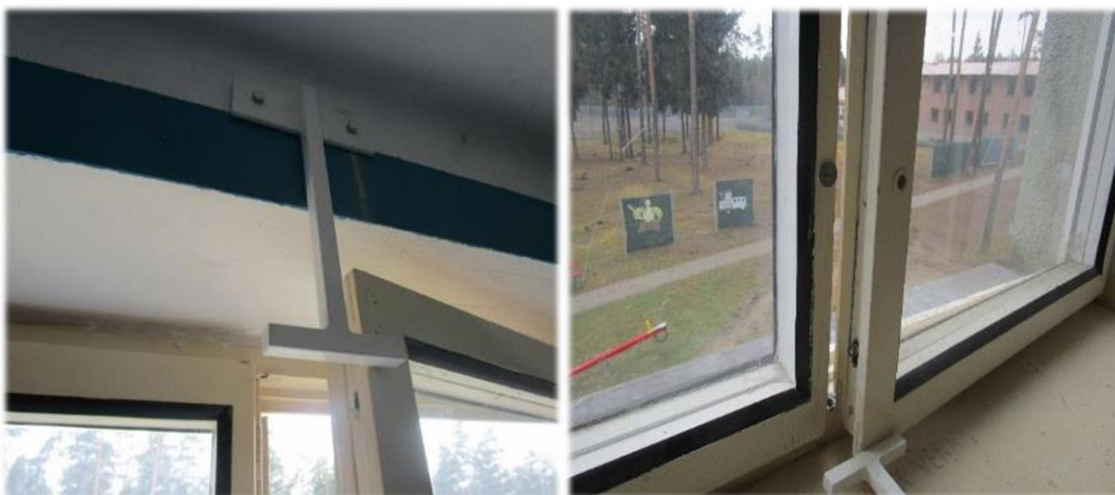
Obrázek č. 3 a 4: zábránky proti otevření oken.

Sdílím obavy personálu o bezpečnost malých dětí, nikoliv však pochopení pro zvolené řešení. Napevno přivrtané zábránky neumožňují rodičům ani samostatně ubytovaným ženám prakticky žádnou manipulaci s okny. Cizinci si ani nemohou vyjít ven na balkon.