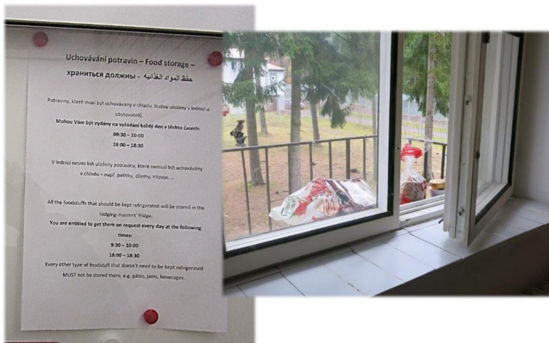
Obrázek č. 5: detail informační nástěnky, obrázek č. 6: potraviny vyskládané na parapetu za oknem.