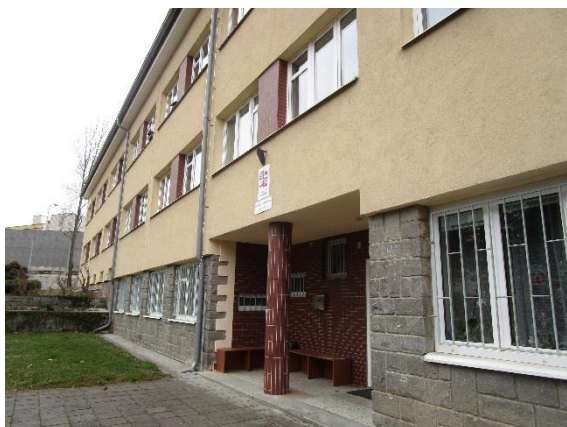
Obr. 1 - průčelí budovy dětského domova

Zařízení leží blízko centra města Humpolec a je součástí veřejné zástavby. Jedná se o tříposchodovou budovu se zahradou, ve které se nacházejí herní prvky (viz obr. 1 a 2), jež nabízejí možnosti sportovního a odpočinkového vyžití. Humpolec je okresní město, děti docházejí do místních škol (popř. také internátních škol) a zájmových kroužků.