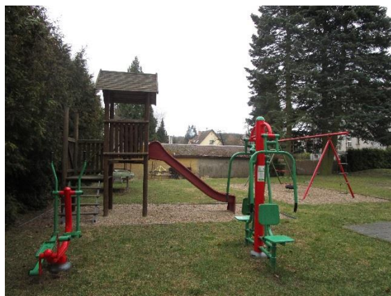
Obr. 2 - přilehlá zahrada