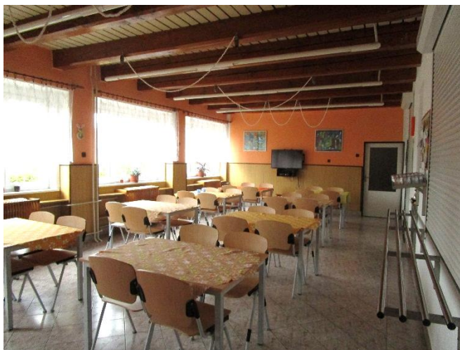
Obr. 8 - společná jídelna

Organizace stravování v zařízení je jedním z prostředků, jak lze napomoci k tomu, aby prostředí dětského domova bylo pro dítě více běžnou domácností než ústavním zařízením. Usedání rodiny ke společnému jídlu je často nejenom společenským rituálem v rodinách, ale i stabilizačním prvkem pro dítě. Společná příprava jídla pak slouží nejenom jako příprava dětí do života, ale zároveň může utužovat rodinnou skupinku a umožní dítěti podílet se na sestavení jídelníčku.