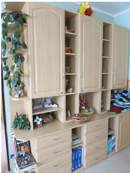
Obr. 3 - obývací pokoj

Prostory rodinných skupinek jsou barevné a působí živě. Pokoje dětí jsou vybaveny postelí, nočním stolem, skříňkami, hračkami i individuální výzdobou. Mnohé děti mají v pokoji vylepeny plakáty, nálepky a také vystaveny nejrůznější hračky a oblíbené předměty či fotky. Děti si mohou požádat o zámek na skříňku, avšak ne všechny této možnosti chtěly podle vlastního vyjádření využít. K vybavení zařízení nemám výhrad.