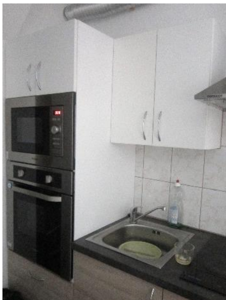
Obr. 7 - kuchyňka v podkroví