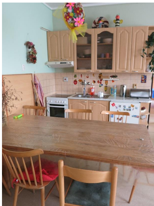
Obr. 4 - kuchyňský kout