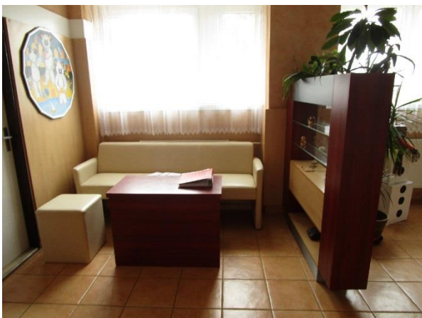
Obr. 6 - návštěvní prostor ve vchodové hale dětského domova