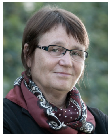
Mgr. Anna Šabatová, Ph.D. veřejná ochránkyně práv

Doporučení je zejména určeno ředitelkám a ředitelům základních škol, jejichž zřizovatelem jsou obce či svazky obcí, 4 krajským úřadům, které posuzují odvolání proti rozhodnutí o nepřijetí dítěte, České