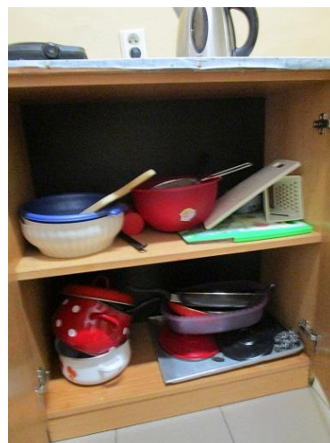
Obr. 1 – 4